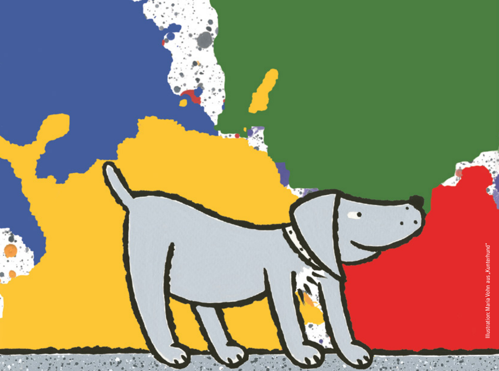
Illustration: Maria Vohn aus „Kunterhund“